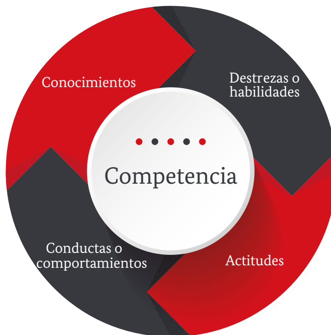
Imagen 2. Enfoque de competencias orientado al mundo laboral

El curso de Soluciones Digitales se trabajó bajo el enfoque de competencias, orientado al mundo laboral referido en la figura 2. Las competencias se definen como un conjunto de conocimientos, habilidades, destrezas y actitudes necesarias para el desempeño de una función productiva que puede ser definida y medida en términos de esfuerzo de un determinado contexto laboral. 8